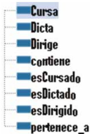
Figura 3. Relaciones entre clases